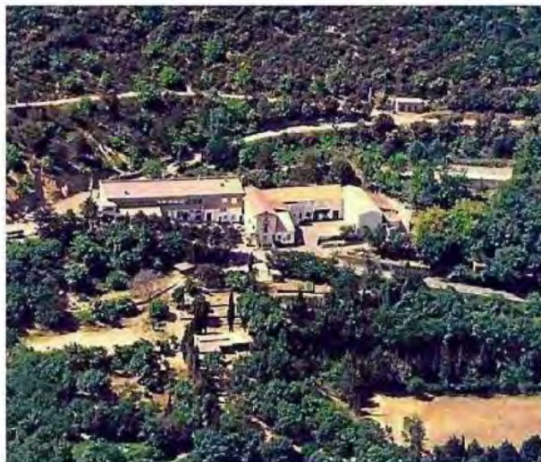
Dès février, le centre de Malibert accueillera des classes vertes.

Le centre PEP de Malibert change de direction. La PEP 34 (Pupilles de l'enseignement public) achète le site de Malibert en 1980 pour en faire une colonie de vacances et un centre d'accueil des classes vertes en partenariat avec l'Éducation nationale et le Département. De nombreux Héraultais ont séjourné à Malibert lors de leur enfance ou de leur adolescence.