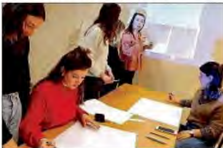
ÉTUDIANTS. Les futurs éducateurs ont planché sur l'aménagement de la crèche de Compreignac.

Aménager et organiser des espaces sécurisants et accueillants où enfants, parents et professionnels peuvent interagir, telle est la commande à laquelle les étudiants de la filière « éducateur de jeunes enfants » de Polaris à Limoges ont répondu pour la micro-crèche La Fée risette de Compreignac, gérée par l'association PEP 87.