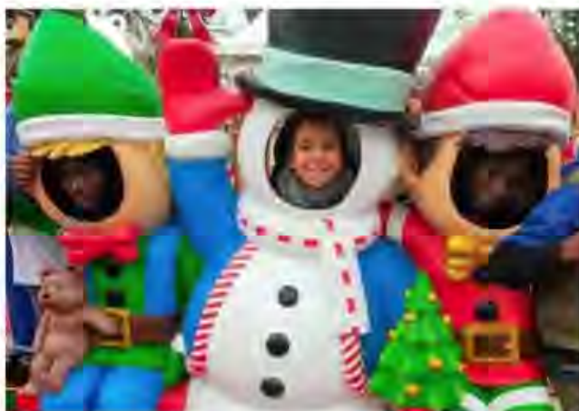
Lors de la sortie à Laval, les enfants ont participé à différentes animations.

Pendant cette colonie de Noël, les enfants ont pu faire le plein d'activités : sorties extérieures, cani-randonnées... La ville de Laval avait également donné des places pour la grande roue et la patinoire. « Le but étant d'offrir des moments fratrie dans la lignée des week-ends fratrie, car nous avons des frères et sœurs dans les Lavallois qui sont en colo », indique Erwan Dagan, directeur du centre de