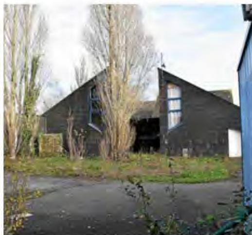
À Arzal, le centre des Pep 56 n'est pas encore vendu. Des études environnementales sont à conduire avant la signature d'un compromis

En un siècle, les Pep 56 ont constitué un patrimoine pour proposer des vacances à vocation sociale en bord de mer. Maintenant que l'association est sortie de ses difficultés financières, où en sont les sites de l'est de Vannes ?