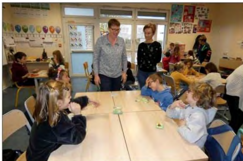
Les enfants ont pris un réel plaisir à jouer.

Les groupes d'élèves se sont amusés avec plusieurs jeux dans un esprit d'équipe, d'entraide, entourés par papy et mamie venus en renfort. Le but étant aussi de réapprendre à jouer dans les foyers aux jeux de société.