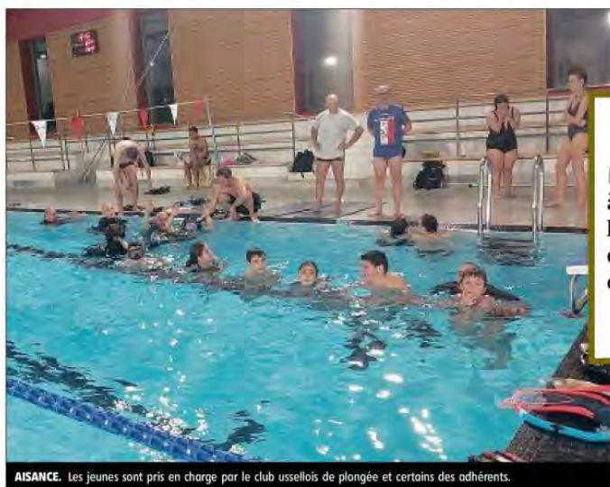
AISANCE. Les jeunes sont pris en charge par le club ussellois de plongée et certains des adhérents.

L'eau a toujours procuré du bien-être à l'être humain. Les thermes romains étaient d'ailleurs plus nombreux que les temples ! « Dans l'eau, ils sont