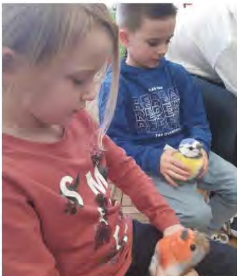
Les enfants ont notamment dû reconnaître le cri des oiseaux fourni par les peluches les yeux fermés.

En plus d'identifier quelques oiseaux communs, un des autres