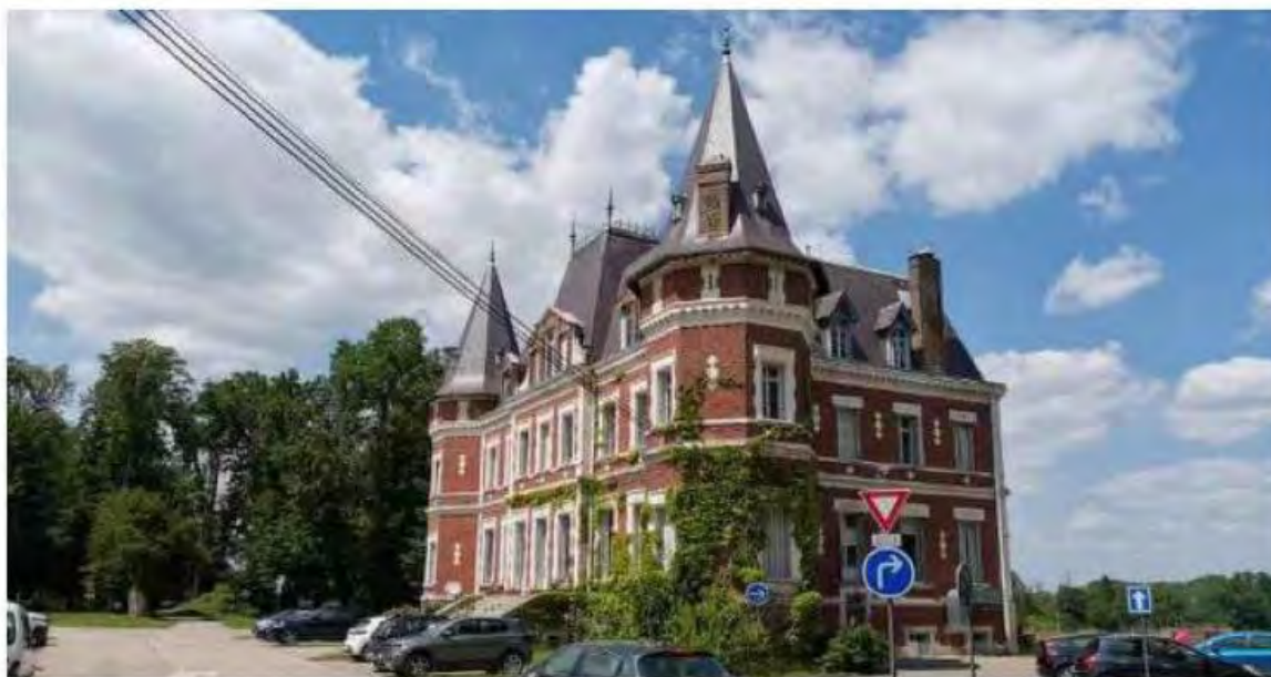
Le château de Montceaux-lès-Vaudes est inoccupé depuis le printemps dernier.