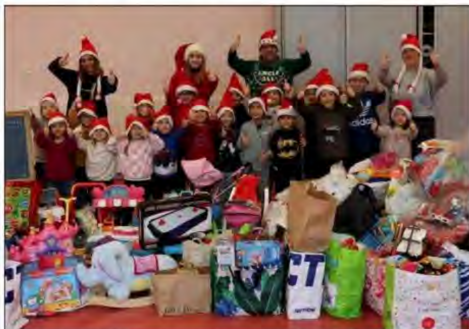
Des centaines de jouets seront redistribués pour que la solidarité ait du sens en cette période de fêtes.

Le centre de loisirs ferme ses portes pour les vacances. Reprise des activités le 3 janvier.