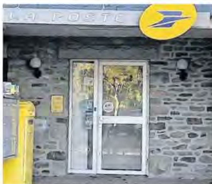
L'actuelle poste place de la mairie

Un projet de neuf lots est accepté par la commune, rue des 5 Sous à proximité du centre-bourg et de l'église. Le conseil devait y porter attention : d'une part la cité est propriétaire