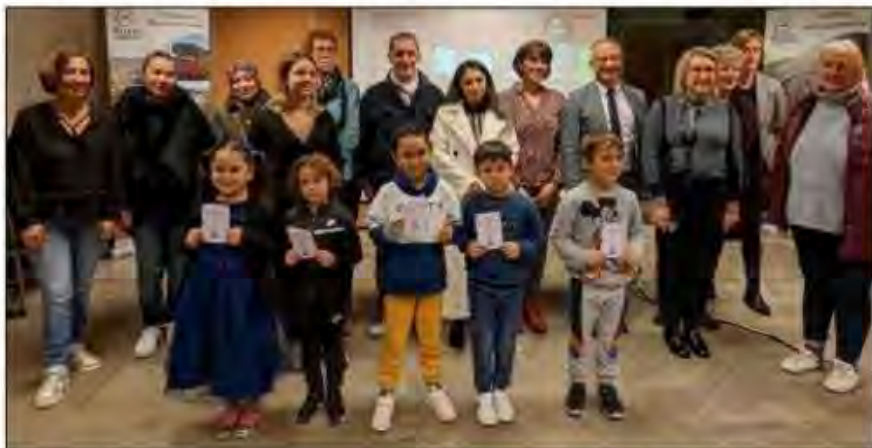
Les cinq « poucets » de l'école de La République.