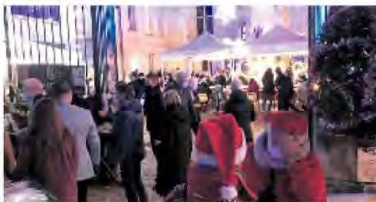
Tout le monde est invité à se joindre au Noël pour tous, place de Châteauneuf, samedi 24 décembre.

Si les nombreux bénévoles associatifs ou privés prépareront