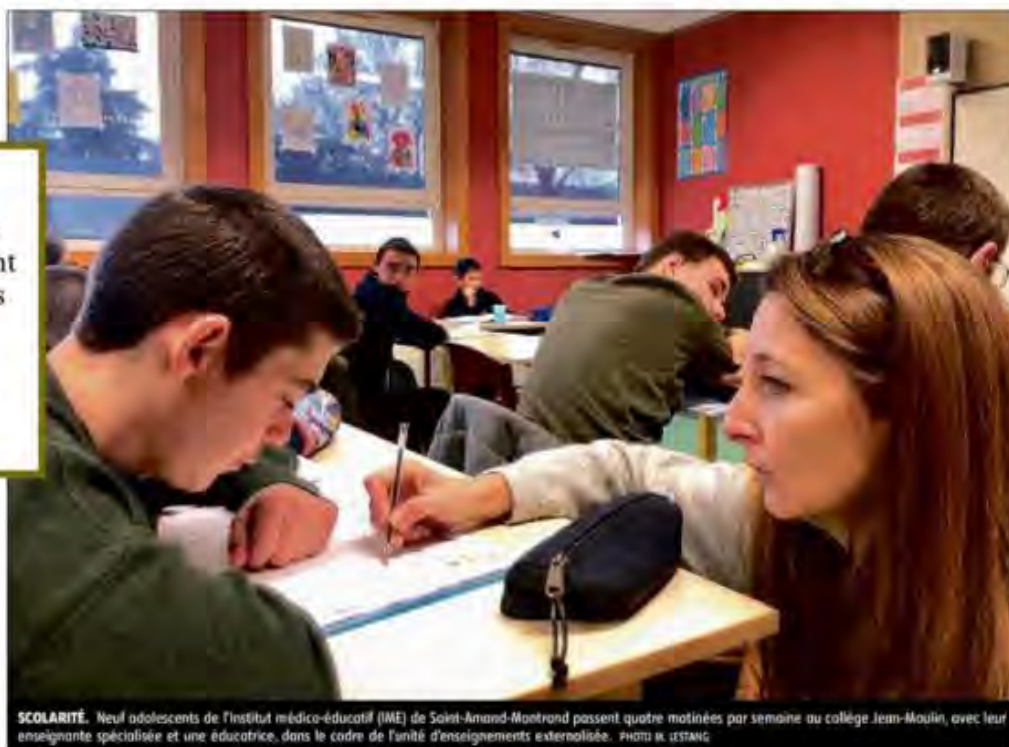
SCOLARITÉ. Neuf adolescents de l'Institut médico-éducatif (IME) de Saint-Amand-Montrond passent quatre matinées par semaine au collège Jean-Moulin, avec leur enseignante spécialisée et une éducatrice, dans le cadre de l'unité d'enseignements externalisée.

« Ça les a fait grandir. Ils sont beaucoup plus à l'aise dans leur rapport aux autres. »