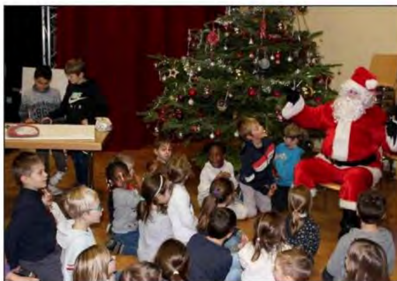
Le père Noël entouré des enfants du périscolaire.

Mardi 13 décembre au soir, les enfants du périscolaire les Écureuils ont fêté Noël à la salle des fêtes.